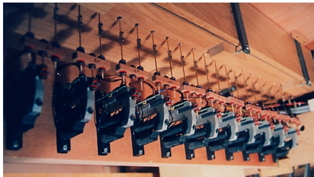
Sensitive Traktur Org-Syncordia (Detail)

Verlangt die Passage etwa ein "legatissimo" mit weit überlappenden Akkorden, oder ein "staccatissimo" mit ultraspitz angezupften Tasten, so ist dies mit dem neuen System plastischer möglich, als mit allen bekannten Traktursystemen.