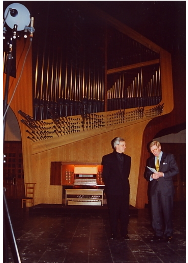
Orgelrezital Bruxelles Chant d'Oiseau (2000)

Klangstaffelung jedoch scheint mir nicht unbedingt so reizvoll.