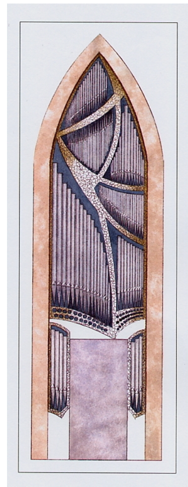
Septfontaines (Projekt J.J.Kasel)

Wie ich heute Simmern sehe, zeigt mein Projekt, das Sie kennen. Die damalige, alte Orgel, war in keiner Hinsicht etwas Besonderes, und auch mit dieser Anzahl an Registern hätte man mehr machen können. Geld, Mangel an Ideen, muss wohl alles eine Rolle gespielt haben.