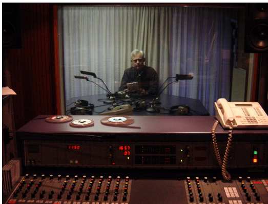
Radio-Einsatz für die Orgel

Ich sprach in „Chamades“ allen professionellen Verknüpfungen additiv hinzu als ausdrücklicher Orgelfreund , und machte eigentlich eine Sendung, die ich mir gerne anhören möchte.