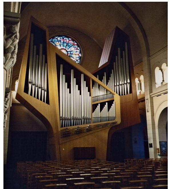
Bruxelles , Notre-Dame des Grâces au Chant d'Oiseau (Kleuker)

Die Flöten und Aliquoten, die Prinzipale, Mixturen und Zungen sind für den Raum so optimal berechnet und intoniert, dass ich diese Orgel unter die 5 Besten rechne, die ich je gespielt habe, und das waren schon einige. Kraft ohne Schärfe, unendliche Lyrik, tausende von möglichen Detailregistrierungen, die jedesmal völlig anders klingen. Dazu verfügt sie, trotz ihrer Größe und architektonischen Komplexität über eine wunderbar sensitive Traktur. Eine Königin unter den Orgeln in Europa. Dies ist eines der Instrumente, wie auch die Kleuker-Steinmeyer Orgel in Zürich, die das 20. Jahrhundert als doch nicht ganz verloren beschreiben.