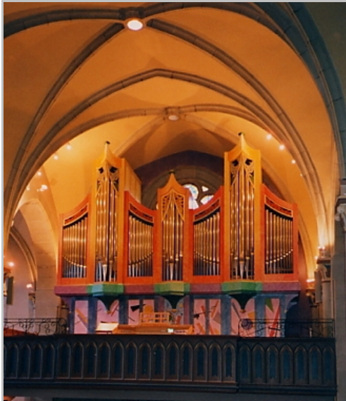
Ursy (CH) Ayer-Orgel mit Org-Syncordia-Traktur

Wie Sie es schon andeuteten, ist besonders die Repetitions-geschwindigkeit und Artikulierbarkeit bei Trillern, auch auf einem einzigen Ton, stupend und von keinem System sonst so zu reproduzieren. Das Ideal der 1:1-Übersetzung ist somit, nach etwa 1000 Jahren, endlich realisiert.