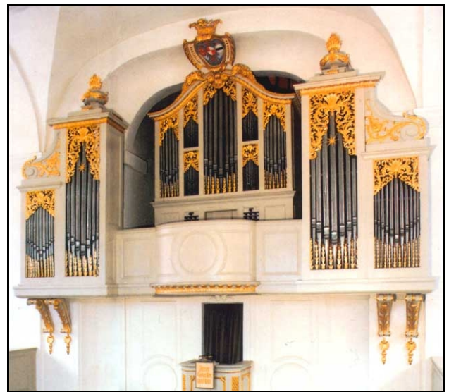
Lahm (Itzgrund) Orgelbau Herbst

Will ich wissen, was Bach sich an einer Traumorgel mittleren Formats gewünscht hat, so fahre ich nach Lahm im Itzgrund. Die dortige Orgel bei uns in irgendeiner Dorfkirche unter Aufbietung aller geschichtsforschender, messtechnischer und materialanalytischer Möglichkeiten 1:1 nochmals zu bauen ist aber ein völlig überflüssiger Akt.